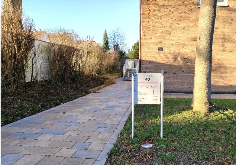
Bild oben: Eingang Gemeindehaus Lukaskirche mit PC-Schulungsraum, VHK-Büro, VHK-Beratungsstelle Bild unten: Eingang Gemeindesaal