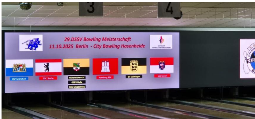
29. DSSV Bowling-Meisterschaft Berlin Neukölln Teilnehmende Vereine

Am 11. Oktober 2025 richtet der Deutsche Schwerhörigen Sport-Verband (DSSV) die 29. Deutsche Meisterschaft im Bowling im Bowlingcenter Hasenheide in Berlin aus. An der Meisterschaft nahmen insgesamt 73 Spie-