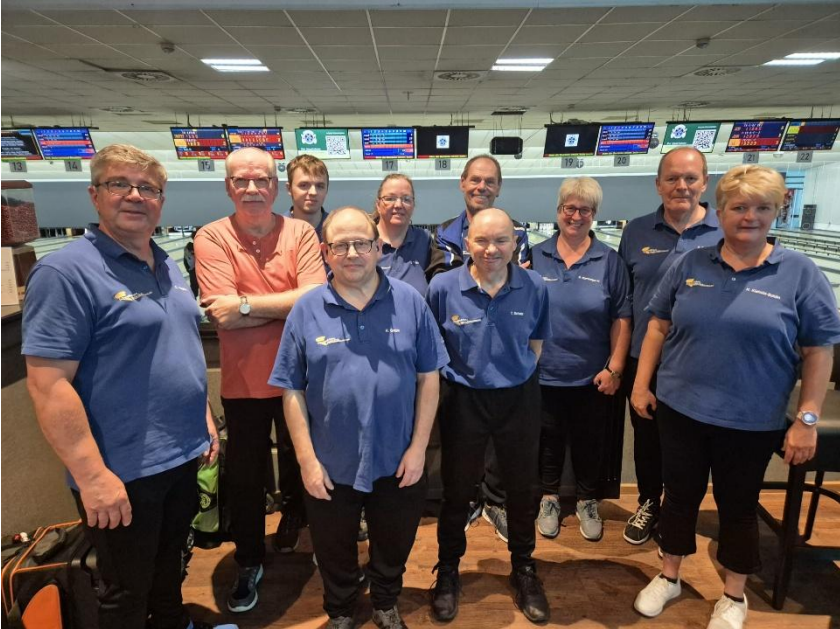
Teilnehmende des SSC Kassel