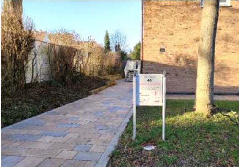
Bild oben: Eingang Gemeindehaus Lukaskirche mit PC-Schulungsraum, VHK-Büro, VHK-Beratungsstelle